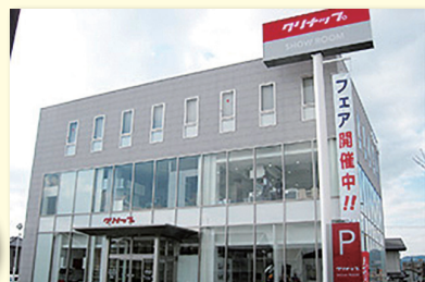
静岡県静岡市駿河区中原331-2