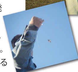
▲「そーれ、舞い上がれ〜!」