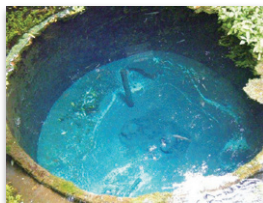
柿田川公園の第二展望台から 見られる「わき間」