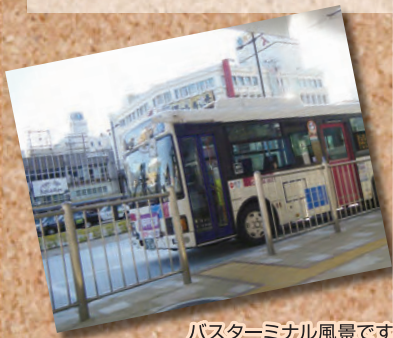
バスターミナル風景です。私が時より利用する庵原線吉原行きです。

今回は、JR清水駅からの眺めをご紹介します。みなさまの中にも、当駅をご利用の方も多くと思いますので、釈迦に説法的な写真になりましたら、お許しください。私も時より、休日の時間がある日は、なるべく電車やバスを利用して出かけます。(なんか楽ちんなので、私は好きです。)写真は、過日清水駅から撮影したものです。なぜわざわざ撮影をしたの?と思われるかもしれませんが、少しだけその理由を...。私は中学生の時、当駅南にあります、魚市場(今は河岸の市としてにぎわっております所)で、毎年夏には、絵描きに行っていました。当時の様子がたまに頭をよぎり、先日、シャッターをきってみました。なつかしさに心なませ、変わってしまった景色に心を向けていました。