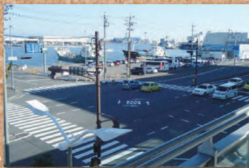
回廊デッキより、海を望む。右側に見えるのが、河岸の市です。(旧魚河岸)