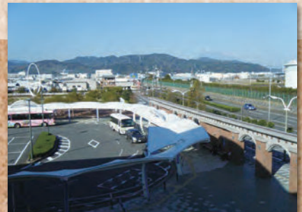
海側のデッキより、富士山を望む。