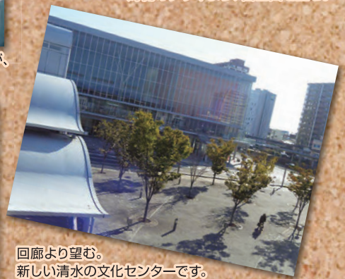
回廊より望む。新しい清水の文化センターです。